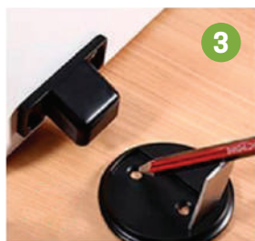
3 Marcar el tope en el piso, en función al ángulo de apertura de la puerta deseado.