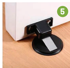
5 Listo para utilizar.