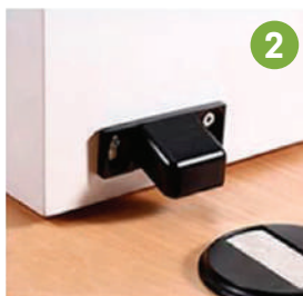
2 Fijarlo con los tornillos.