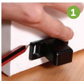
1 Marcar el taco en la puerta, en función al tope.